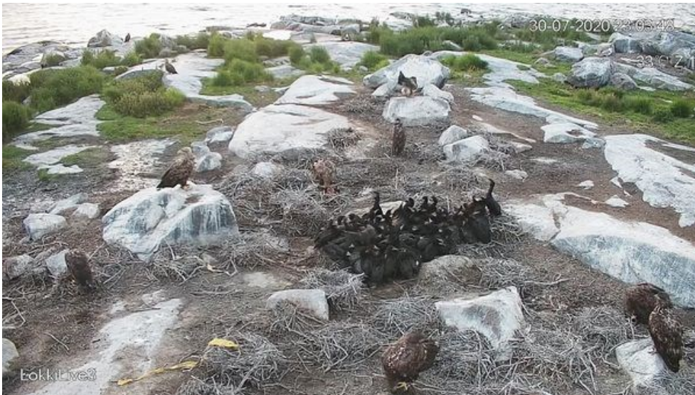
Exempelbild : En ring av örnar runt skarvungarna

Bilderna: i bildbilagan finns 24 förminskade fotografier utvalda bland 1000 original.